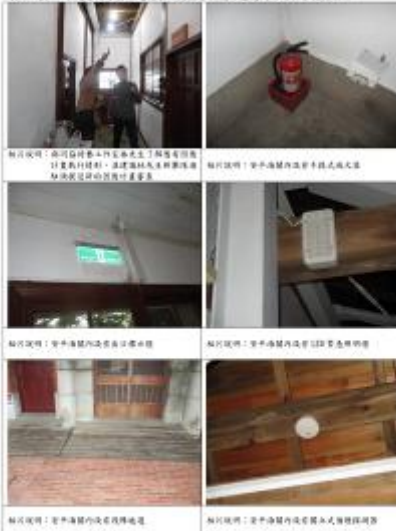
表 3-20 「市定古蹟原台南運河安平海關」使用許可初勘情形照片

照片說明：市定古蹟原台南運河安平海關內設有消防設施 照片說明：市定古蹟原台南運河安平海關內設有消防設施 照片說明：市定古蹟原台南運河安平海關內設有消防設施 照片說明：市定古蹟原台南運河安平海關內設有消防設施 照片說明：市定古蹟原台南運河安平海關內設有消防設施 照片說明：市定古蹟原台南運河安平海關內設有消防設施