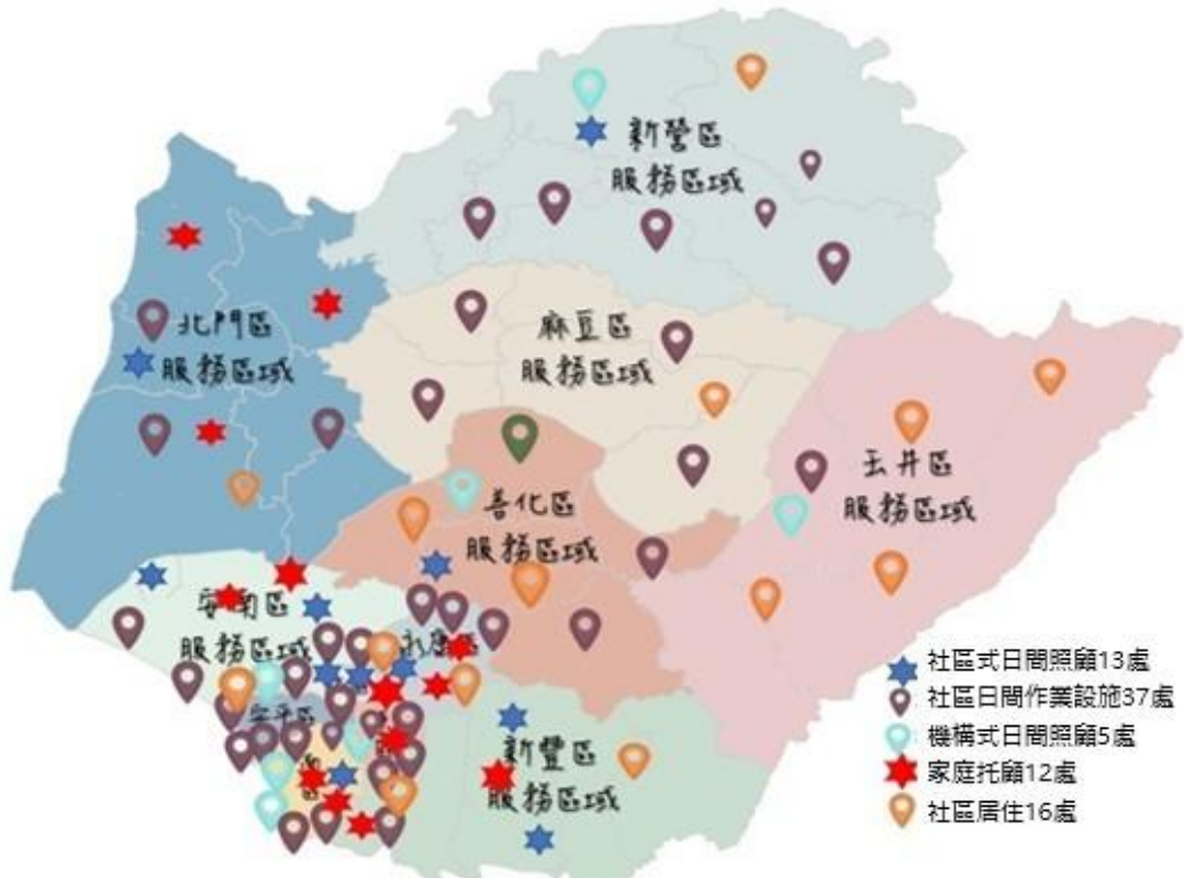
圖 一、現有身心障礙社區式照顧服務資源分布圖