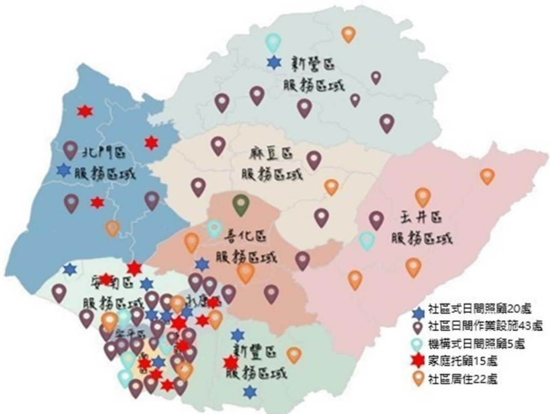
圖 二、115年身心障礙社區式照顧服務資源布建規劃分布圖