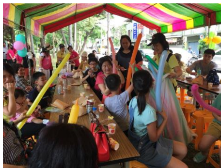
[北區振興社區辦理情形]

(6)推動都會型社造： 基於台南市都市發展的特殊性，公寓大廈組織相對其他五都較少，故持續鼓勵都會區內之社區發展協會於計畫執行時廣邀所在地之公寓大廈居民參與，如中西區銀同社區、永康區復國社區、南區國宅社區等皆透過社造課程、公民審議、藝術活動辦理等廣邀區內公寓大廈居民參與。