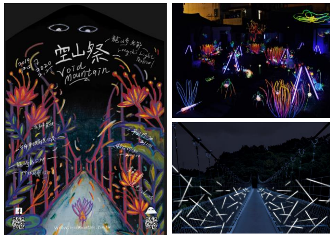
[結合竹林創作光環境]

110年度，本局持續辦理龍崎光節空山祭，展期自2020/12/25至2021/2/28計66日，透過公部門、社區、青年團隊、大專院校就在地議題反覆盤整與推進，讓空間美學概念進入居民生活，以此帶動龍崎區價值的轉化及南關線整體的活絡，讓人口流失的空山印象轉為蘊藏豐富自然人文之美的共生地帶。