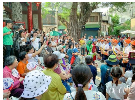
[中西區銀同社區辦理情形]