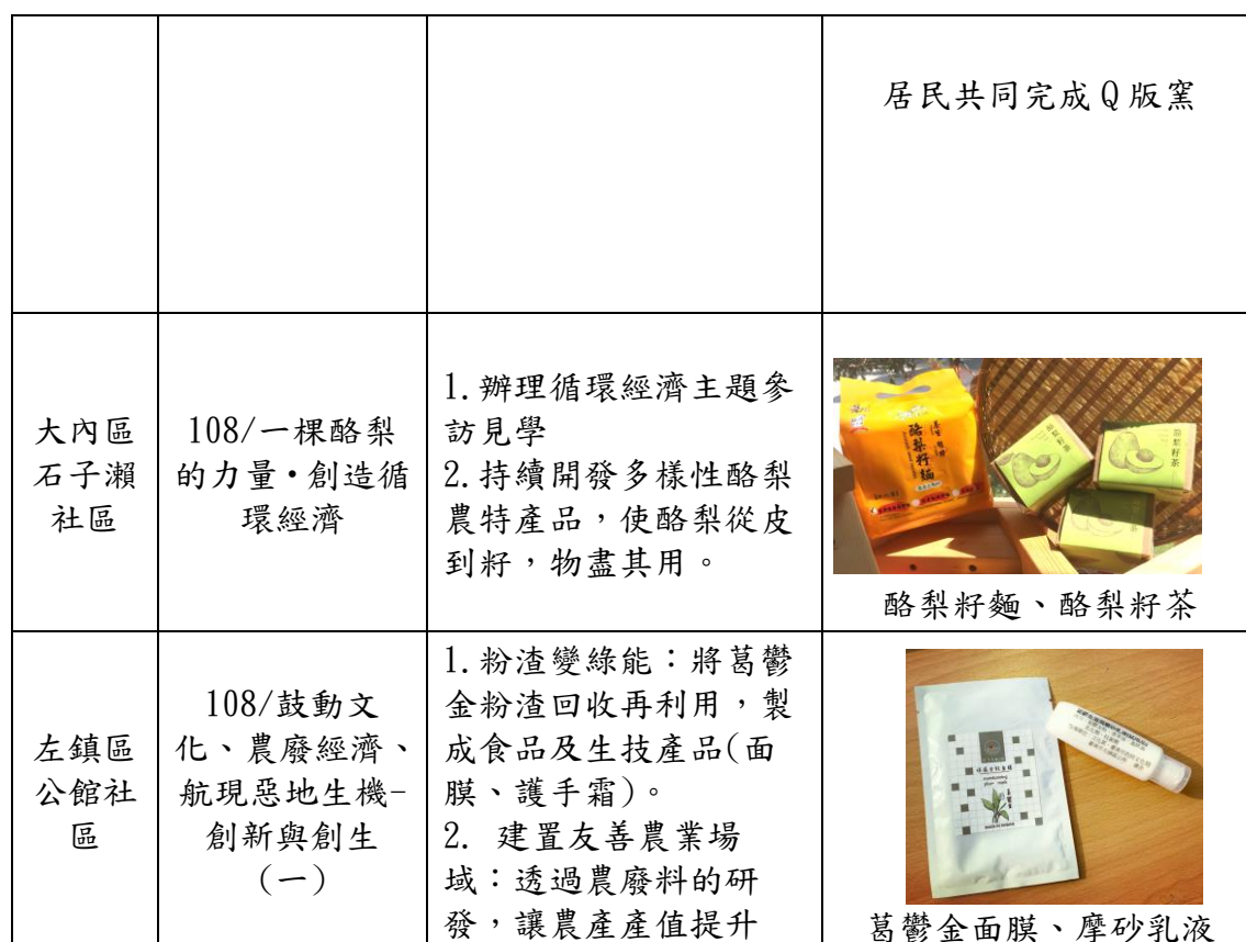
[社造點辦理循環經濟案例表]