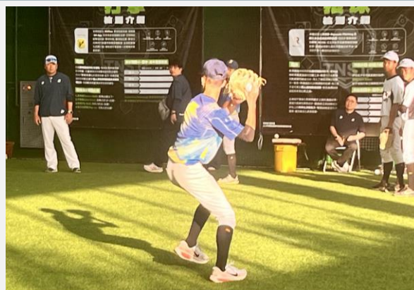
樂天春訓期間指導本市選手