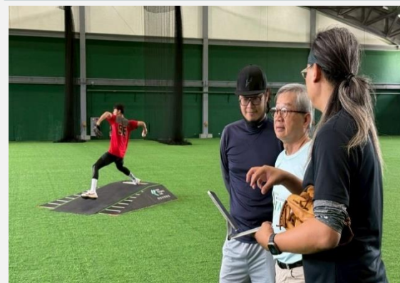
投打練習數據及應用計畫