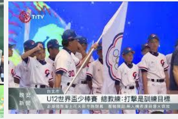
中華隊成軍記者會