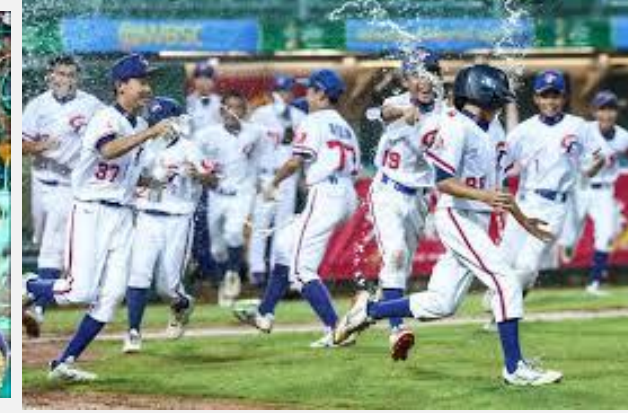
第六屆U12少棒賽在亞太棒球場