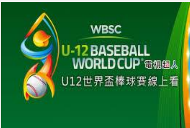
WBSC連續七屆在臺南舉行