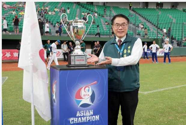
第12屆亞洲U15青少棒錦標賽

※亞太國際棒球訓練中心成棒主球場竣工後第一場國際賽，臺灣小將留下冠軍，意義非凡。