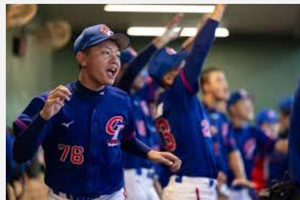
中華隊贏得冠軍瞬間