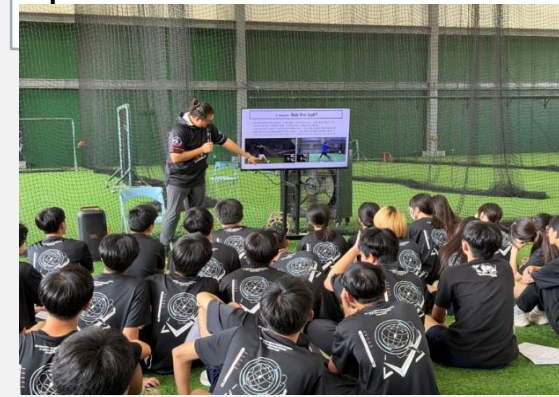
選手投打練習數據及應用計畫