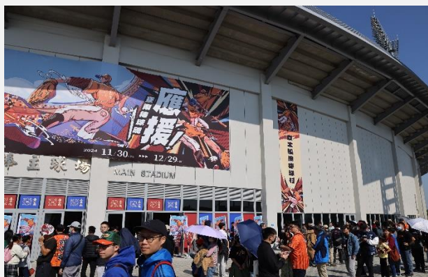
臺南400棒球歷史文化展