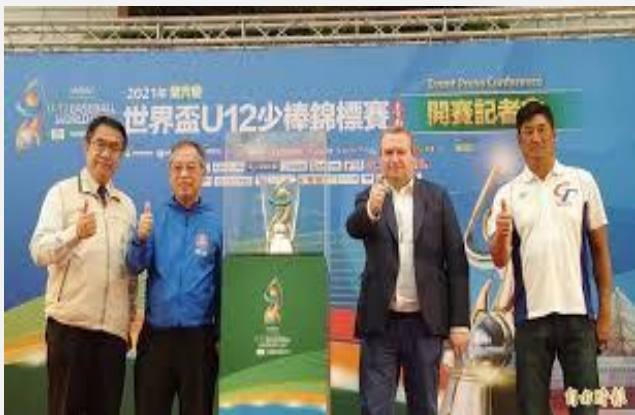
U-12開賽記者會大合照

※臺南自2015年起成為WBSC U-12世界盃少棒賽的常態舉辦城市，中華隊在臺南主場展現了極佳的競爭力。 ※中華隊曾連續三屆（2015, 2017, 2019）闖入冠軍決賽，並於2019年在亞太國際棒球訓練中心成功奪冠。 ※多年來七月賽期時常遭逢大雨、颱風，球場排水系統均非常順暢，受WBSC及國內、外教練讚賞。