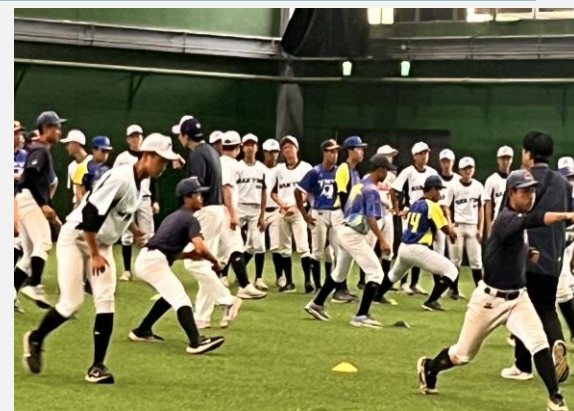
樂天隊春訓期間指導本市選