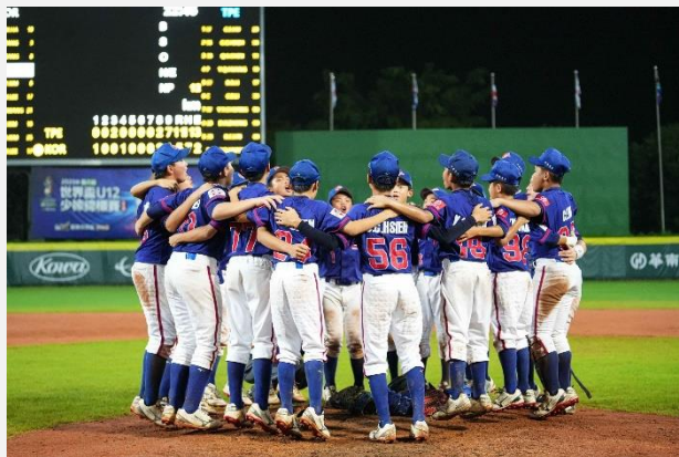
2025年中華隊擊敗韓國隊