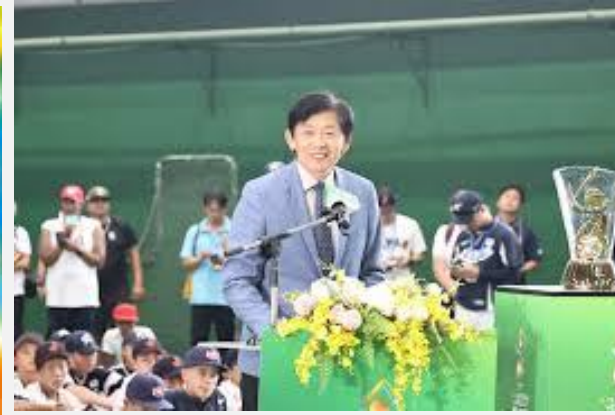
臺南市葉副市長主持閉幕頒獎