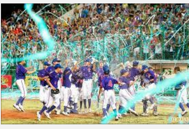
2019年我國獲得冠軍瞬間