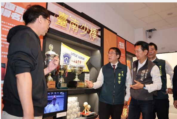
臺南400棒球歷史文化展