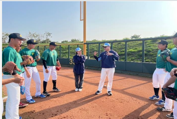
樂天隊春訓與城市棒球隊交流