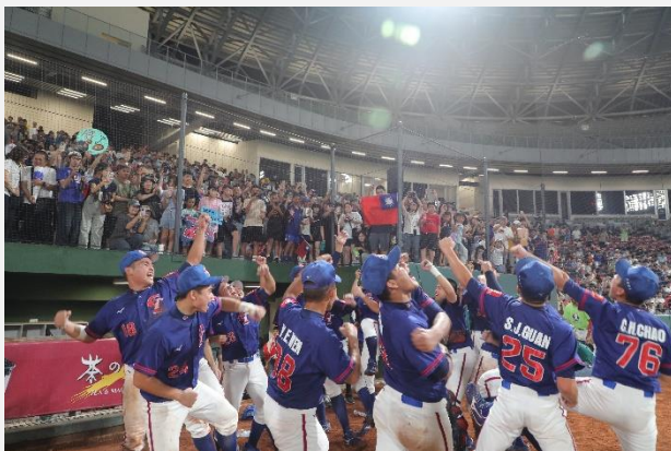
第12屆亞洲U15青少棒錦標賽