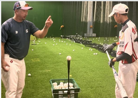
樂天巨人隊指導基層選手

深化國內外球隊訓練比賽並藉由職棒回饋基層及指導教練、選手。 運動技科注入提升效率。 成立人才培育中心。