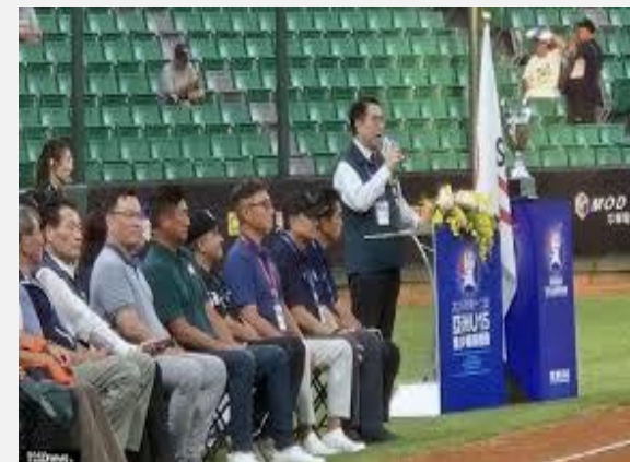
開幕典禮黃市長致歡迎詞