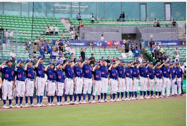
中華隊選手及教練合照