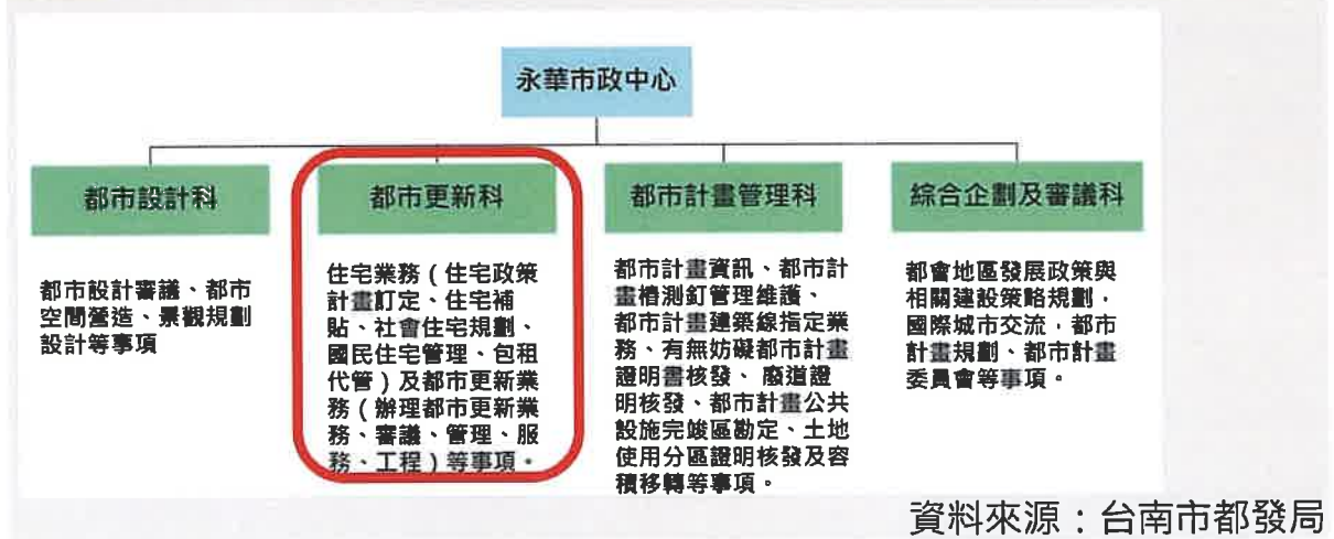
圖 2，臺北都發局組織架構

在這是臺南市都發局的組織架構，可以觀察到，社會住宅的部分，下轄在「都市更新科」，換言之，該科人力除了要處理都市更新相關業務，還要負擔日漸沉重「社會住宅」業務。