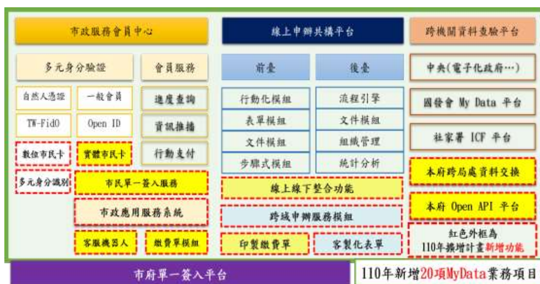
圖 2 計畫整體架構(109~110 年)

綜合上述，本府長期推動線上服務，持續善用 My Data 的特性與便利性，並隨著「國發會個人化資料自主運用(My Data)平臺」的資料集種類越來越多，本府將持續滾動式調整既有申辦項目的資料集種類，以及可以考量可納入一站式服務的新業務項目，逐年擴大服務範圍。