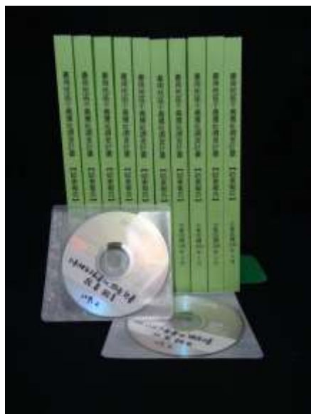
108 年臺南地區不義遺址調查計畫。