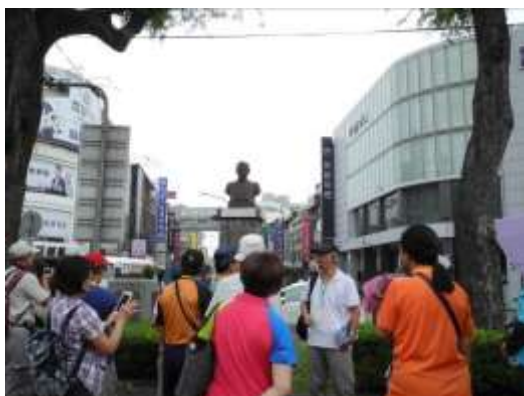
106 年走訪人權活動——湯德章紀念公園，講述湯德章律師的正義與勇氣，湯律師在這附近被槍決。