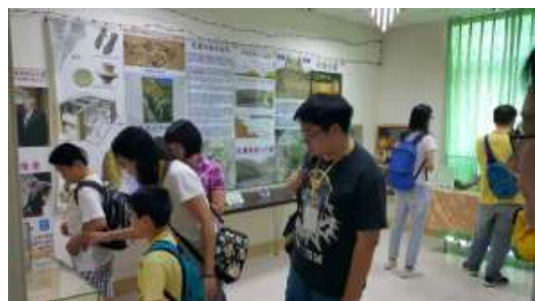
106 年走訪人權活動-參訪臺灣唯一以「猶太人文物」為典藏主題的文化館，稱「臺灣 Holocaust 和平紀念館」。