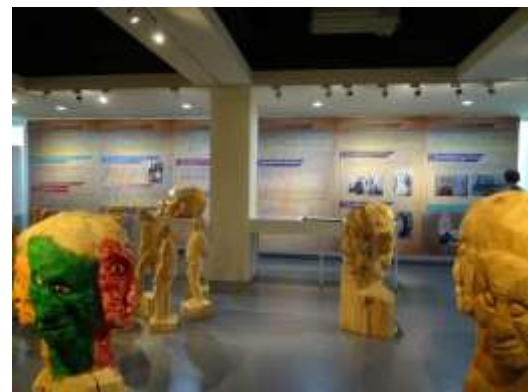
104 年「白色眠夢臺南市政治受難者故事展-內容有木雕/油畫/受難者故事等