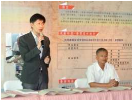
104 年文化局葉局長主持「白色眠夢-白色恐怖時期臺南市政治受難者故事展」記者會