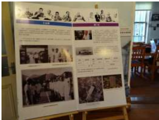
103 年「追尋白色迷蹤」——戒嚴時期臺南市政治受難人故事展