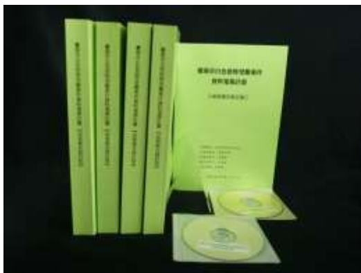
107 年 臺南市白色恐怖受難案件 資料蒐集計畫。