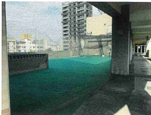
說明：空地目前樣貌(從教室旁看)