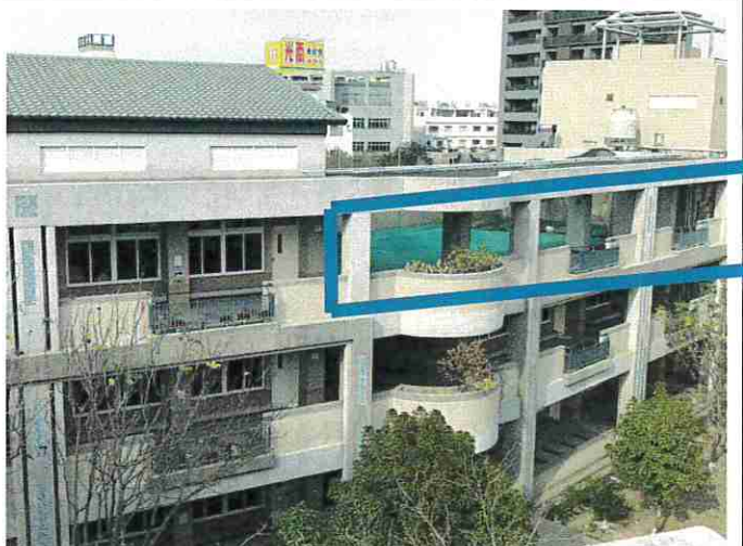
說明：空地目前樣貌 (從另一棟屋頂往下看，遠拍)