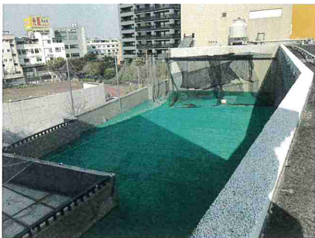
說明：空地目前樣貌(從同一棟屋頂往下看)