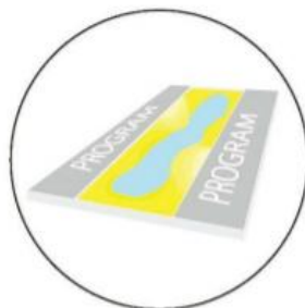
水資源再利用與城市降溫