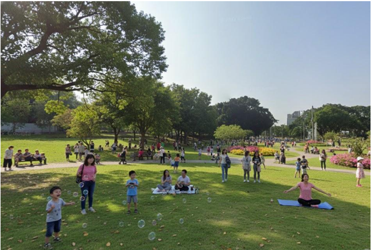
長興公園環境整合改造工程-動線優化與土地活化，納入整體規劃，提高連續與完整性