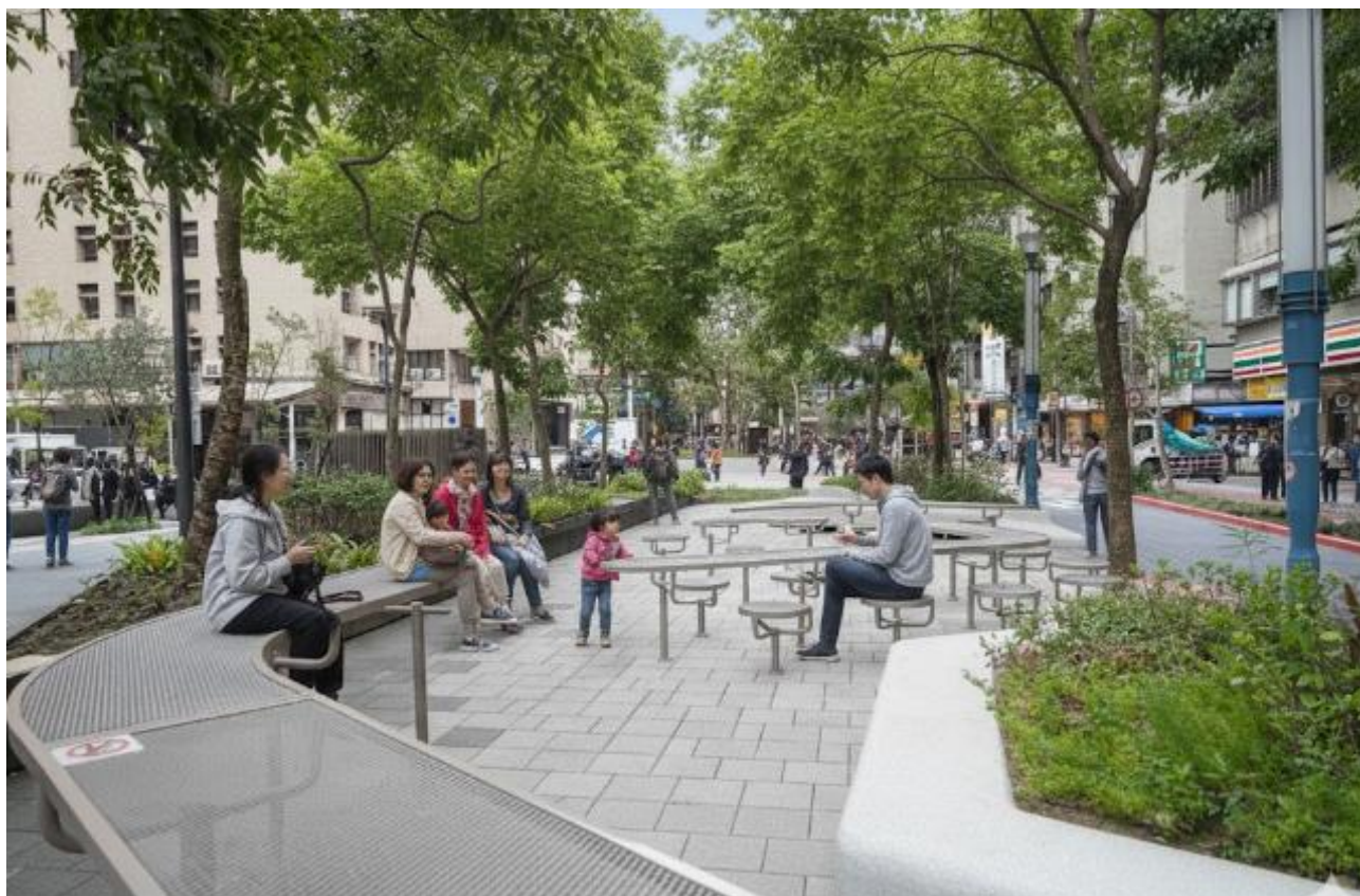
長興公園環境整合改造工程-畸零地整合營造，藝文商業區側，都市面向公園配置

針對南側鄰接之「台南轉運站」進行邊界介面處理，強化人流導引效率；同時前瞻性地回應忠義路西側「藝文觀光商業特區」之開發需求，預留活動銜接介面，使公園成為未來商業活動與交通轉運間的緩衝綠核。