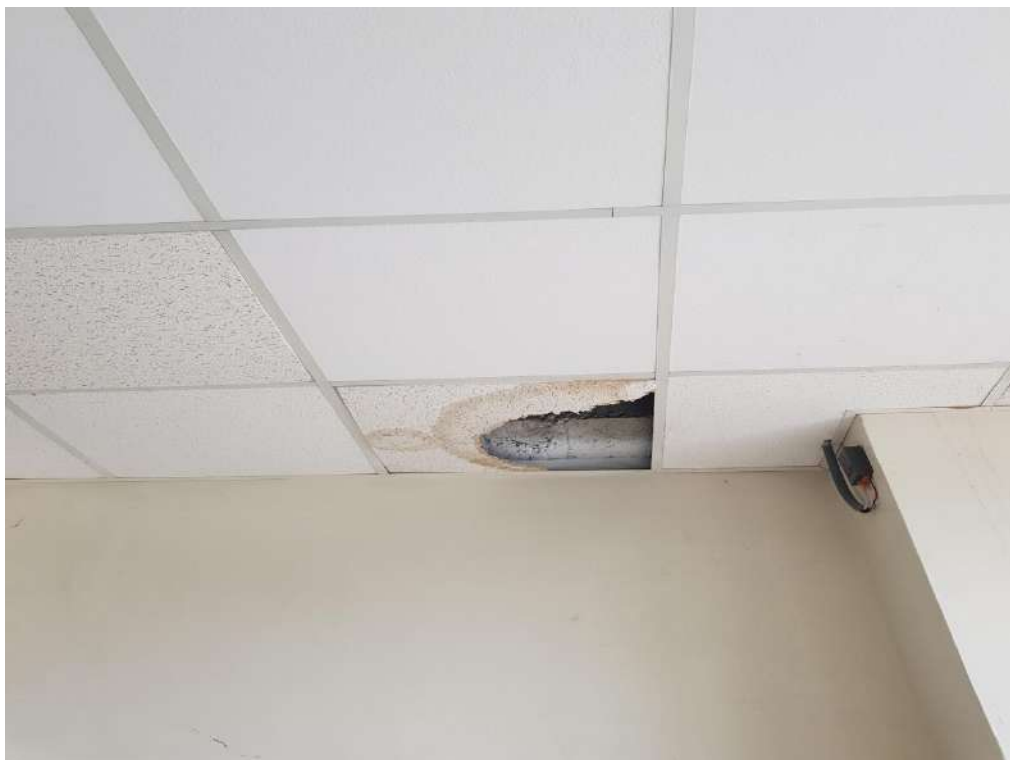
圖：建物防水功能不佳，導致室內天花板損壞