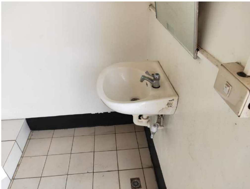
圖：廁所已老舊，難以負荷民眾需求