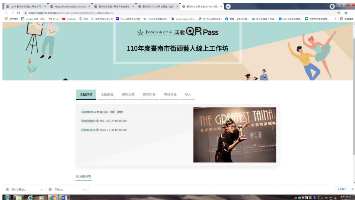
圖示：線上教學首頁頁面