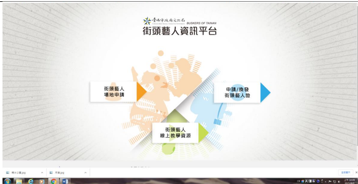
圖示：南市街頭藝人資訊平台-線上教學入口